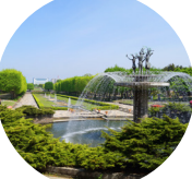
昭和記念公園 / 自転車8分 (約1,920m / 徒歩24分)